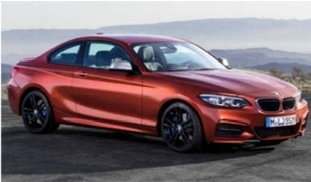
VISTA 3/4 FRENTE