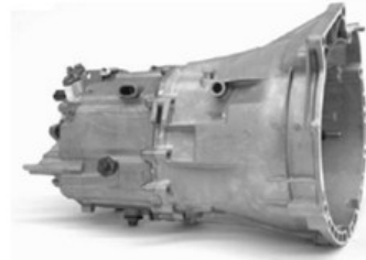
Caja de velocidades Vista costado izquierdo