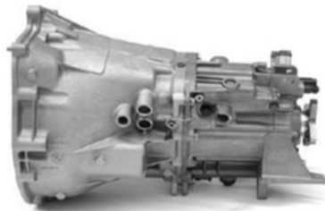
Caja de velocidades Vista costado derecho