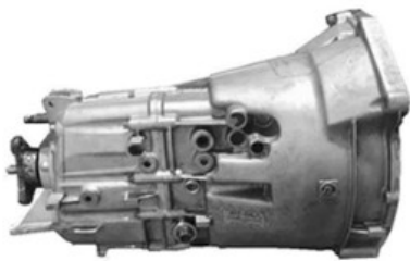
Caja de velocidades Vista costado derecho