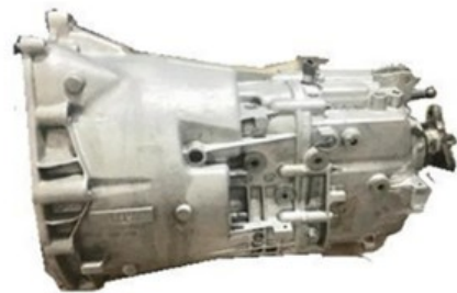
Caja de velocidades Vista costado izquierdo