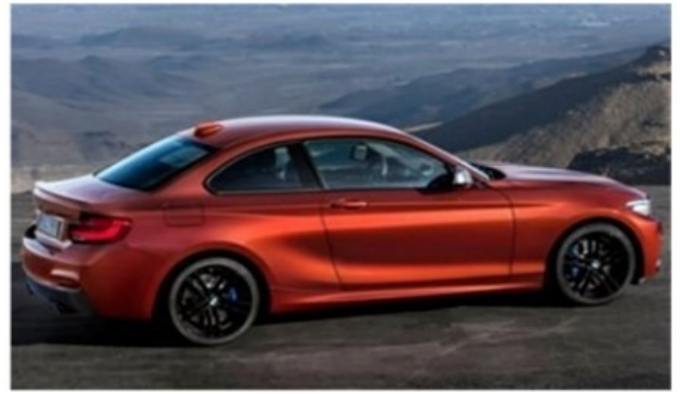
VISTA 3/4 TRASERA